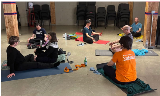
Sport & yoga