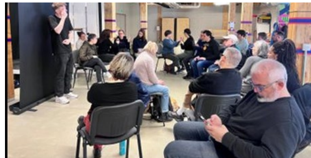
Café rencontre thématique