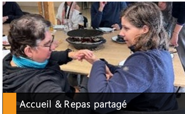
Accueil & Repas partagé